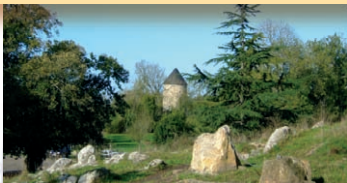
Le Tertre du Mont-Dol