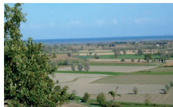
Vue sur la Baie et le Marais

4 Tourner à gauche, franchir le pont et traverser la D155. Prendre une petite à droite pour regagner le bourg.